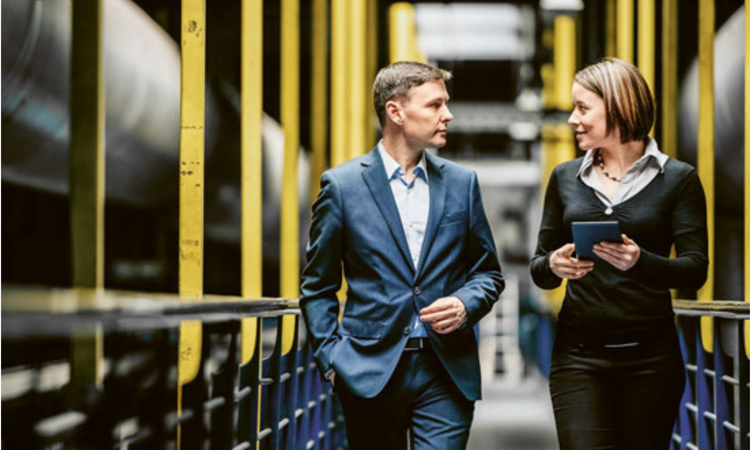
Frauen und Männer begegnen sich am besten auf Augenhöhe.